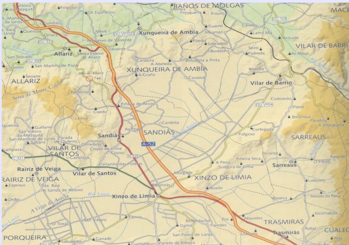
Mapa topográfico da área 1:200.000

Fonte do texto: Atlas de Galicia (2001), baixo a dirección de Andrés Precado e José Sancho. SITGA.