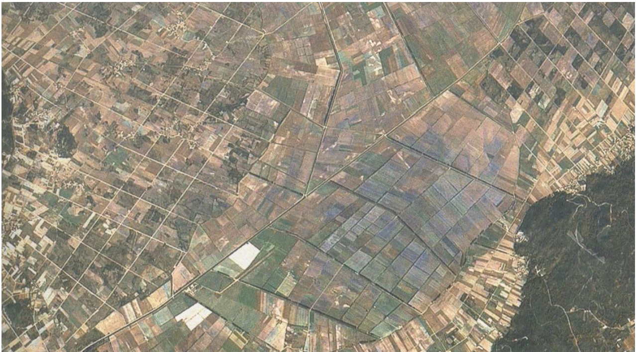
Vista da zona da lagoa de Antela